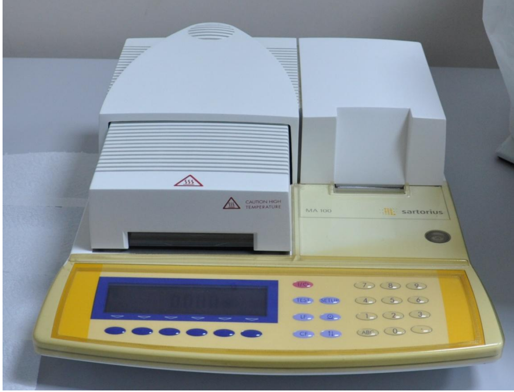
Şekil 3.3. Nem oranlarını belirlemede kullanılan nem ölçme cihazı