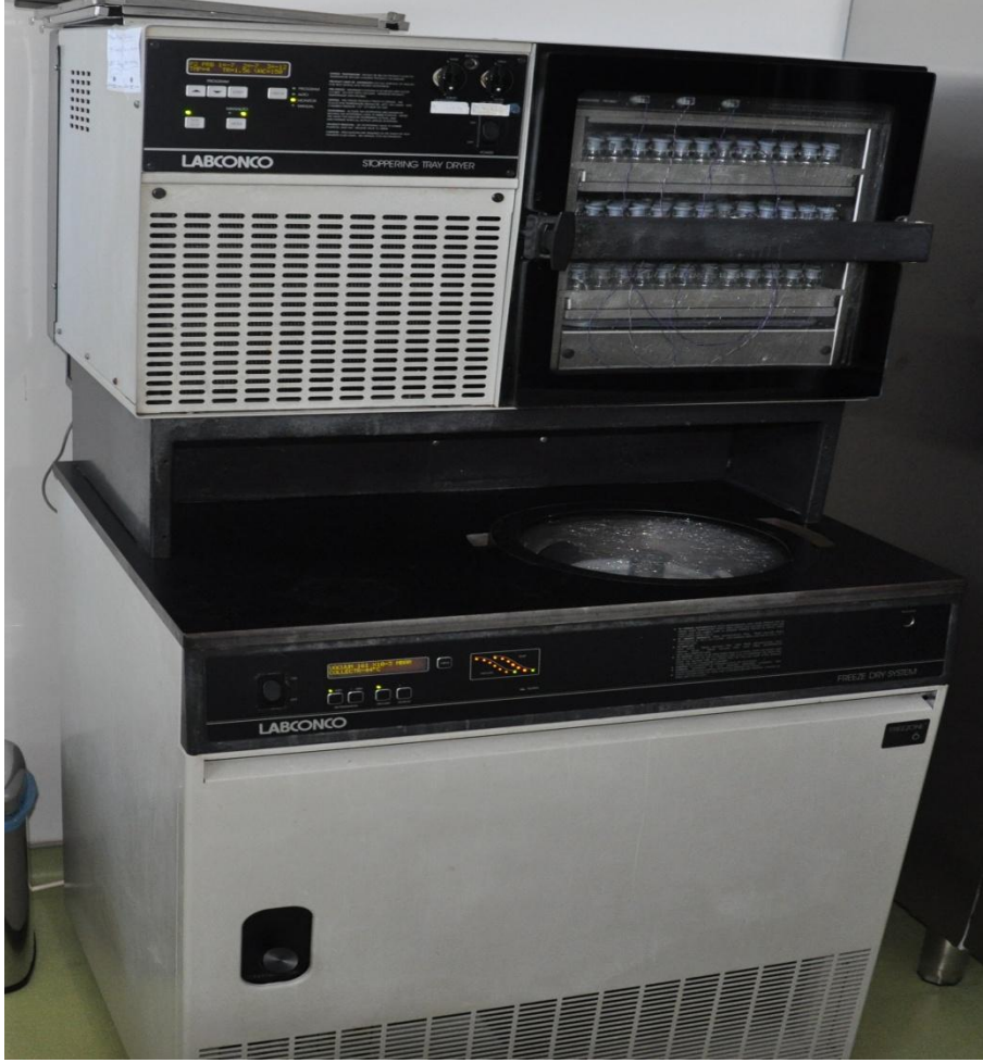
Şekil 2.2.5. Çalışmada kullanılan Liyofilizasyon cihazı